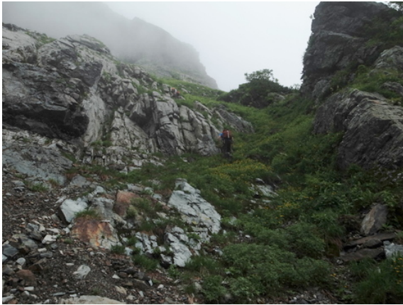
写真5 第3尾根下部草付き