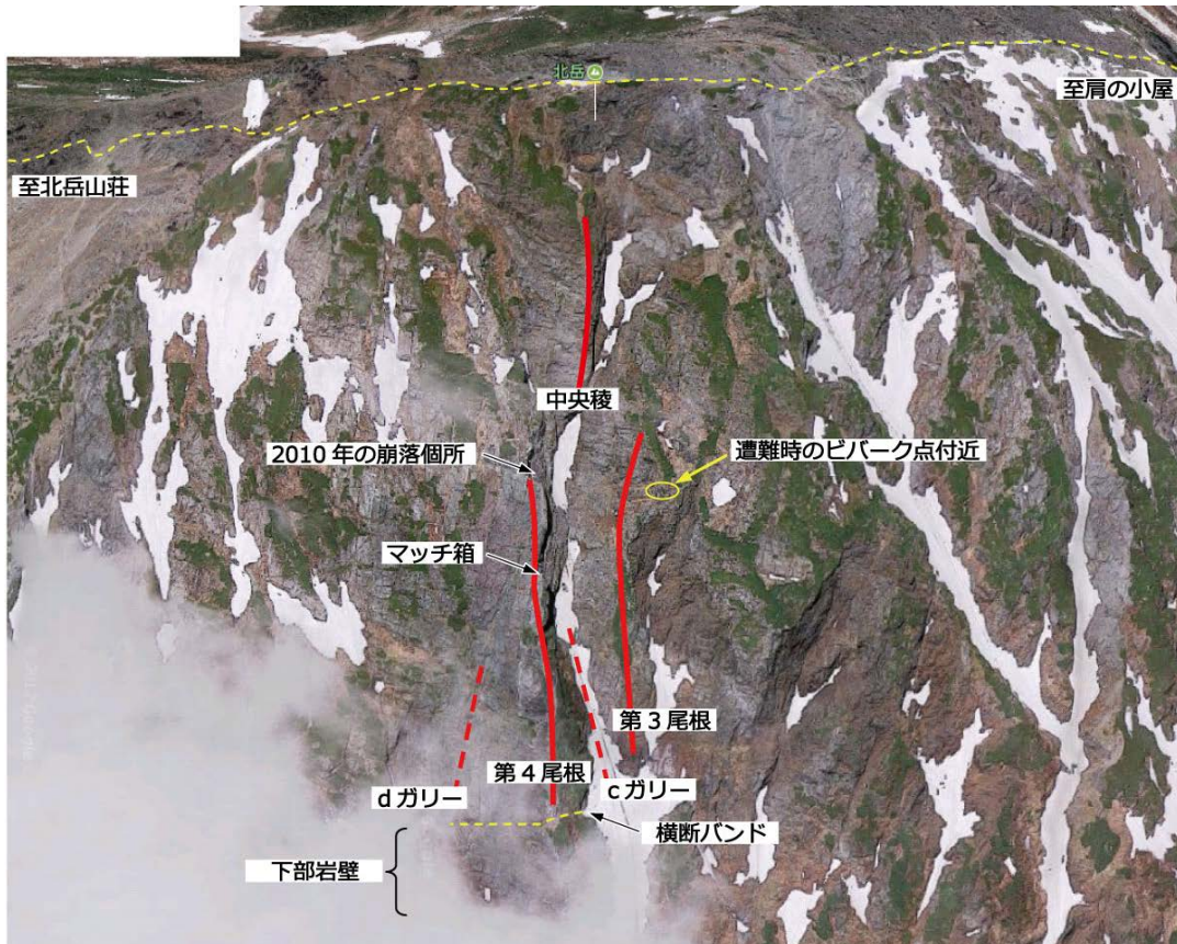
図1 北岳バットレス全景