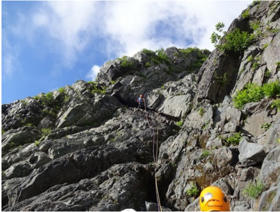
写真1 Dガリー大滝1ピッチ目