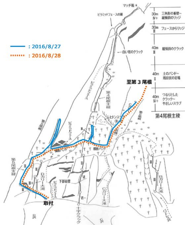
図2 松並・辻パーティーの辿ったルート(概念図出展：新版日本の岩場)