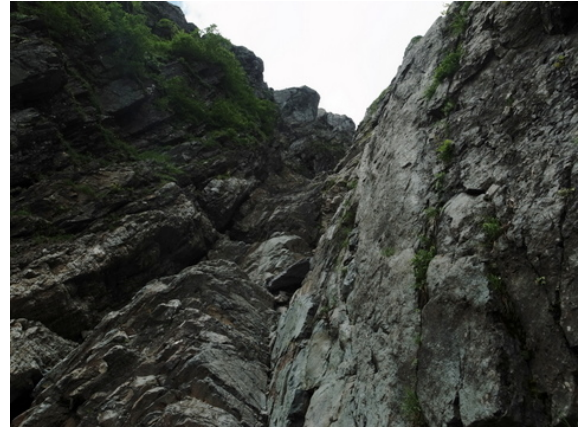
写真10 右側が第3尾根下部の垂壁