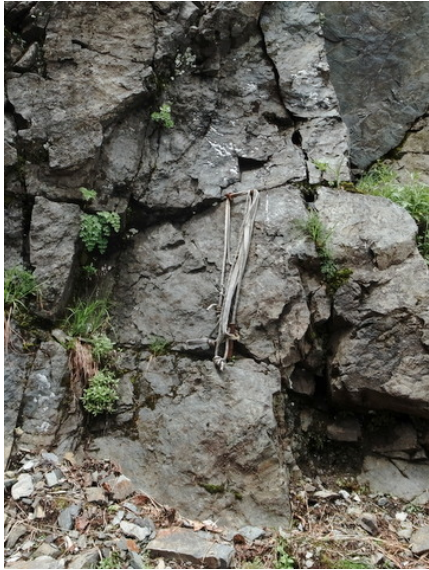
写真7 第3尾根下部の残置支点